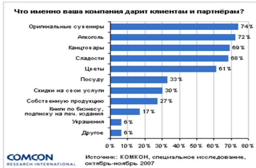
Рис. 2 Статистика подарков (2)

В настоящее время индустрия подарков набирает обороты. Рынок постепенно структурируется.