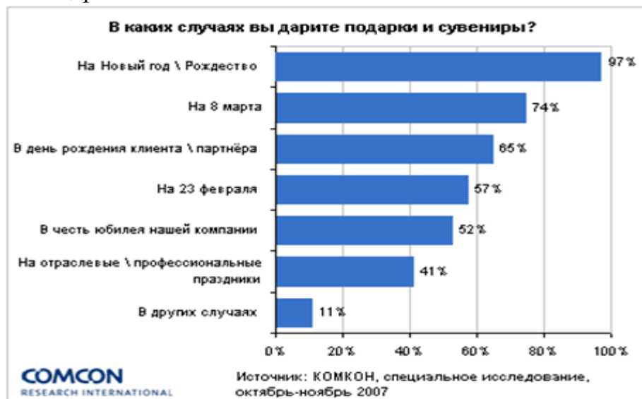
Рис. 1 Статистика подарков

Согласно результатам опроса около 50% опрошенных дарят подарки своим близким, знакомым и др.